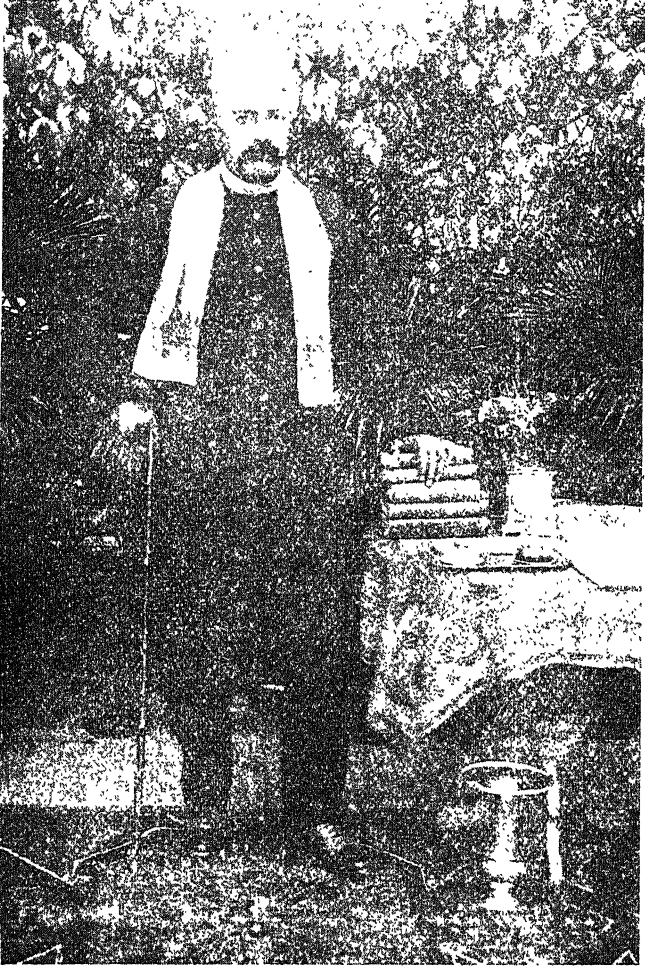
आलोचक तथा निबंधकार प्रेमघन (४० वर्ष)